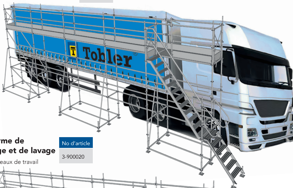
Plate-forme de dégivrage et de lavage